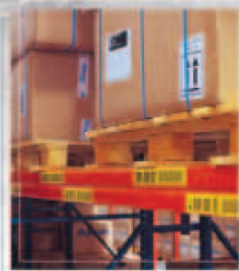
Damit Sie sich in Ihrem Lager schneller zurechtfinden!