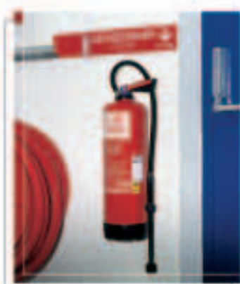
Machen Sie Ihre Beschriftung aussagekräftiger, geben Sie ihr eine persönliche Note.