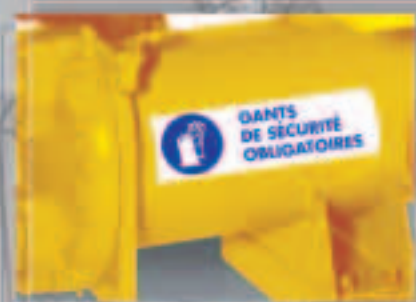
Eine effiziente Kennzeichnung, um Unfälle zu vermeiden !

Einfach im Gebrauch, qualitativ hochwertiger Druck, kompakt... MINIMARK™ ist die ideale Kombination zwischen Benutzerfreundlichkeit und Wettbewerbsfähigkeit. Endlich eine Lösung für Jedermann.