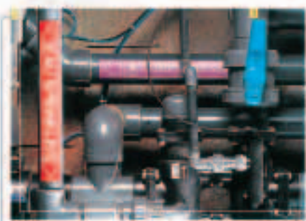
Für die Kennzeichnung Ihrer Rohre vor Ort!