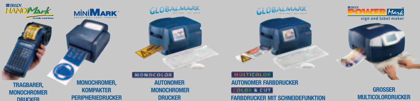
TRAGBARER, MONOCHROMER DRUCKER